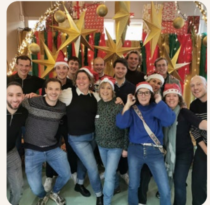
Magische Wintermarkt - Stichting Eerlijke Start