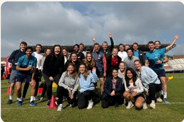
De Spelen Amsterdam - NL Cares