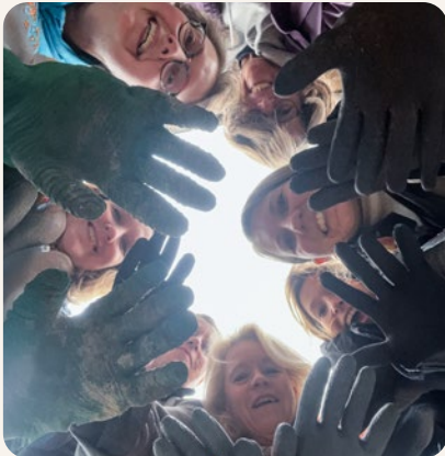
Tuinieren - Stichting Present Amsterdam