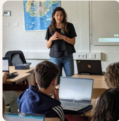
Financiële Gastles - Stichting FEEN