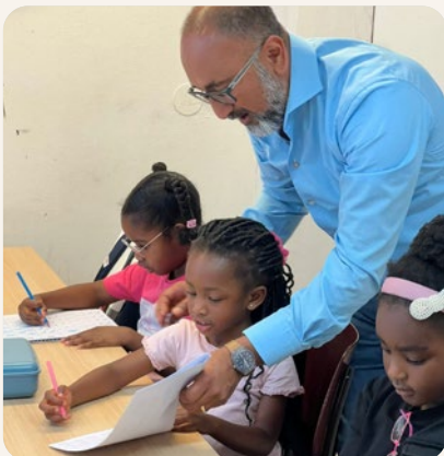
Zomerschool - Stichting Scientia Potentia Est (SPE)