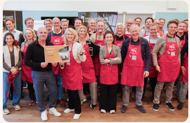
Week tegen Eenzaamheid - Resto VanHarte