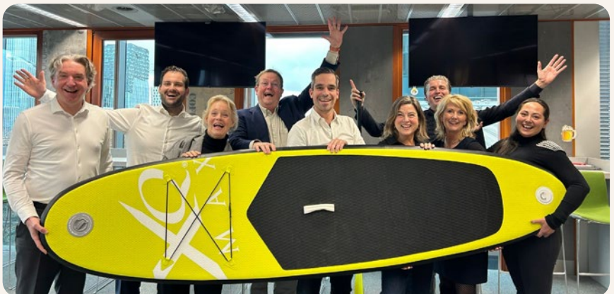
Topsport Community Award voor bestuur en bureaudirecteur Van Lanschot Kempen Foundation