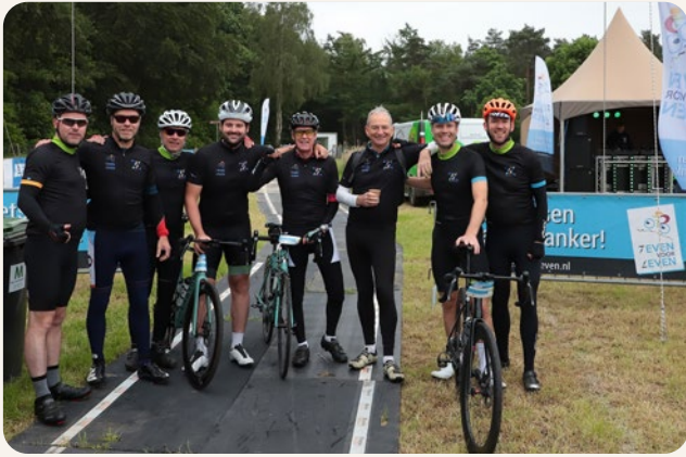
Zeven Heuvelen fietstocht - Zeven voor Leven