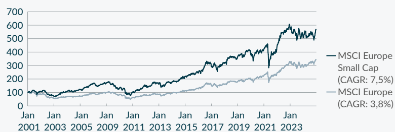
Grafiek 1: Lange termijn performance MSCI Europe Small cap vs MSCI Europe